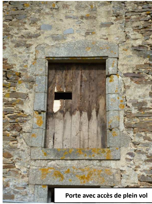
Porte avec accès de plein vol

Et en prime quelques bêtes en hibernation dans les coners de l'Abbaye... histoire de voir des chauves-souris !! L'Abbaye de Clairmont, monument historique, est un site sous convention. Ce site est considéré comme d'importance départementale pour l'hibernation des chauves-souris. De la reproduction pour le Petit Rhinolophe a été observée en 2012.... Affaire à suivre !