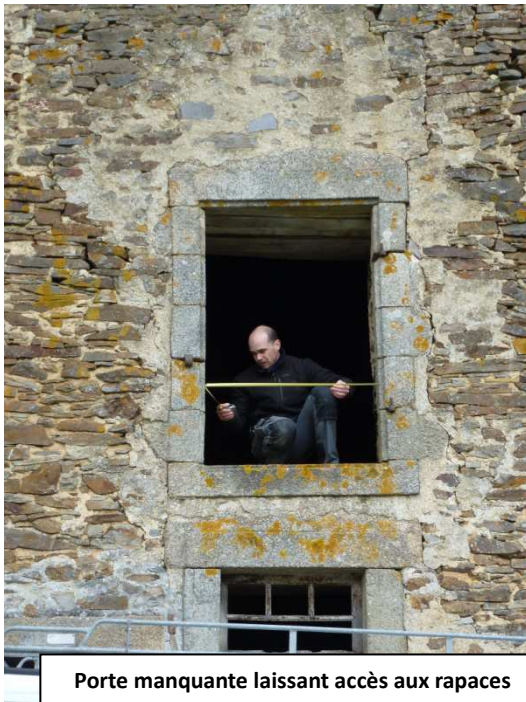
Porte manquante laissant accès aux rapaces

Le dimanche, à l'Abbaye de Clairmont, sur la commune d'Olivet, une porte a été posée sur l'étage d'une façade. Une ancienne porte trouvée sur place a été retaillée et renforcée puis mise dans l'embrasure de la porte manquante. Ainsi, la luminosité est bien moindre dans ce comble et l'ouverture qui a été faite permettra aux chauves-souris de passer sans que les rapaces nocturnes ne puissent accéder au comble. Une petite colonie de Petit Rhinolophe a été découverte en 2012 dans une partie de ce comble.