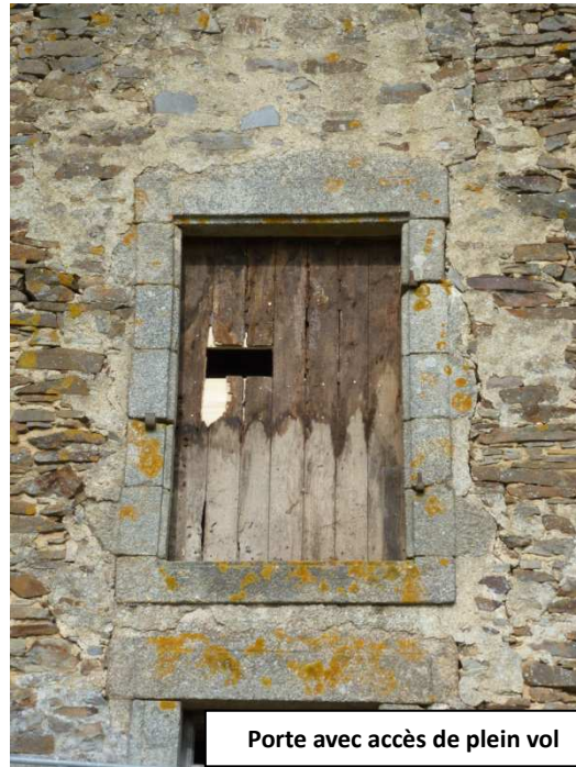
Porte avec accès de plein vol

Et en prime quelques bêtes en hibernation dans les coners de l'Abbaye... histoire de voir des chauves-souris !! L'Abbaye de Clairmont, monument historique, est un site sous convention. Ce site est considéré comme d'importance départementale pour l'hibernation des chauves-souris. De la reproduction pour le Petit Rhinolophe a été observée en 2012.... Affaire à suivre !