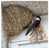
Hirondelle fenêtre – B. Baudin