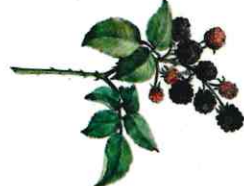
Ronce des bois