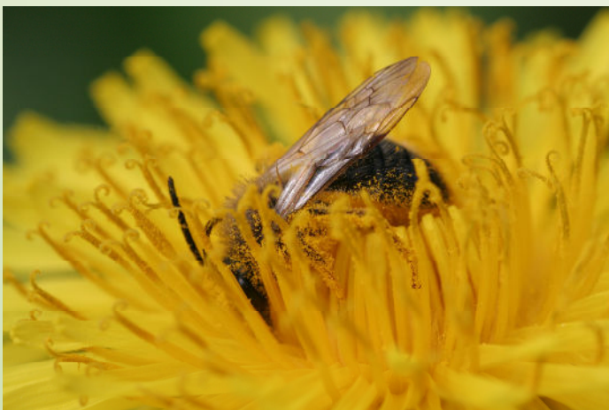
Abeille mellifère (O. Duval)