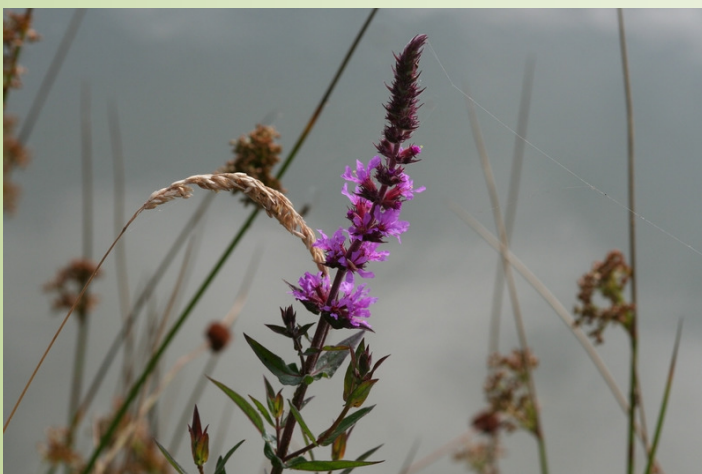
Salicaria (O. Duval)