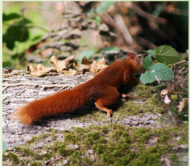
Écureuil roux (J.Degand)