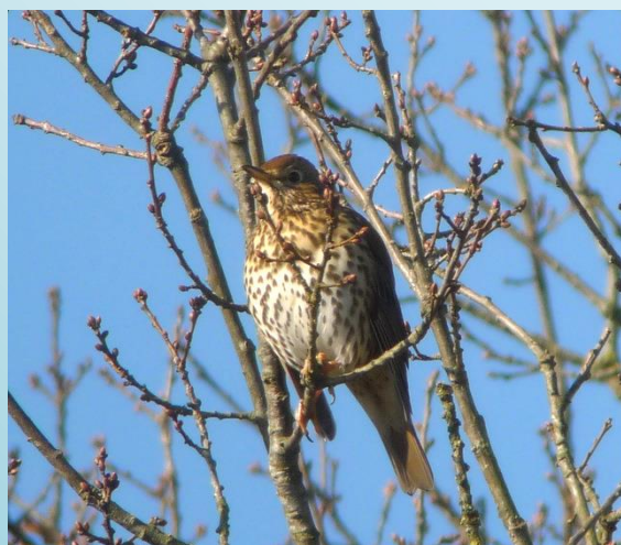
Grive musicienne (J.Degand)