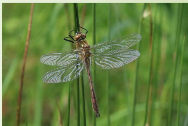
Emergence Cordulie bronzée

Le site compte 187 espèces de plantes dont 3 à valeur patrimoniale en Pays-de-la-Loire : la Corrigiole des grèves, le Myosotis des bois et le Scirpe des bois. La faune est représentée par 3 espèces d'amphibiens (grenouilles verte et agile, Triton palmé – protégé au niveau national), 20 espèces de libellules dont la Cordulie bronzée, la Naiade aux yeux rouges et l'Agriion mignon (espèces patrimoniales), 19 espèces de papillons dont le Flambé, 35 espèces d'oiseaux (Pic épeiche, fauvettes, grives, Faucon crécerelle) et 6 espèces de mammifères. Le printemps et l'été sont les périodes les plus favorables à l'observation de cette biodiversité.