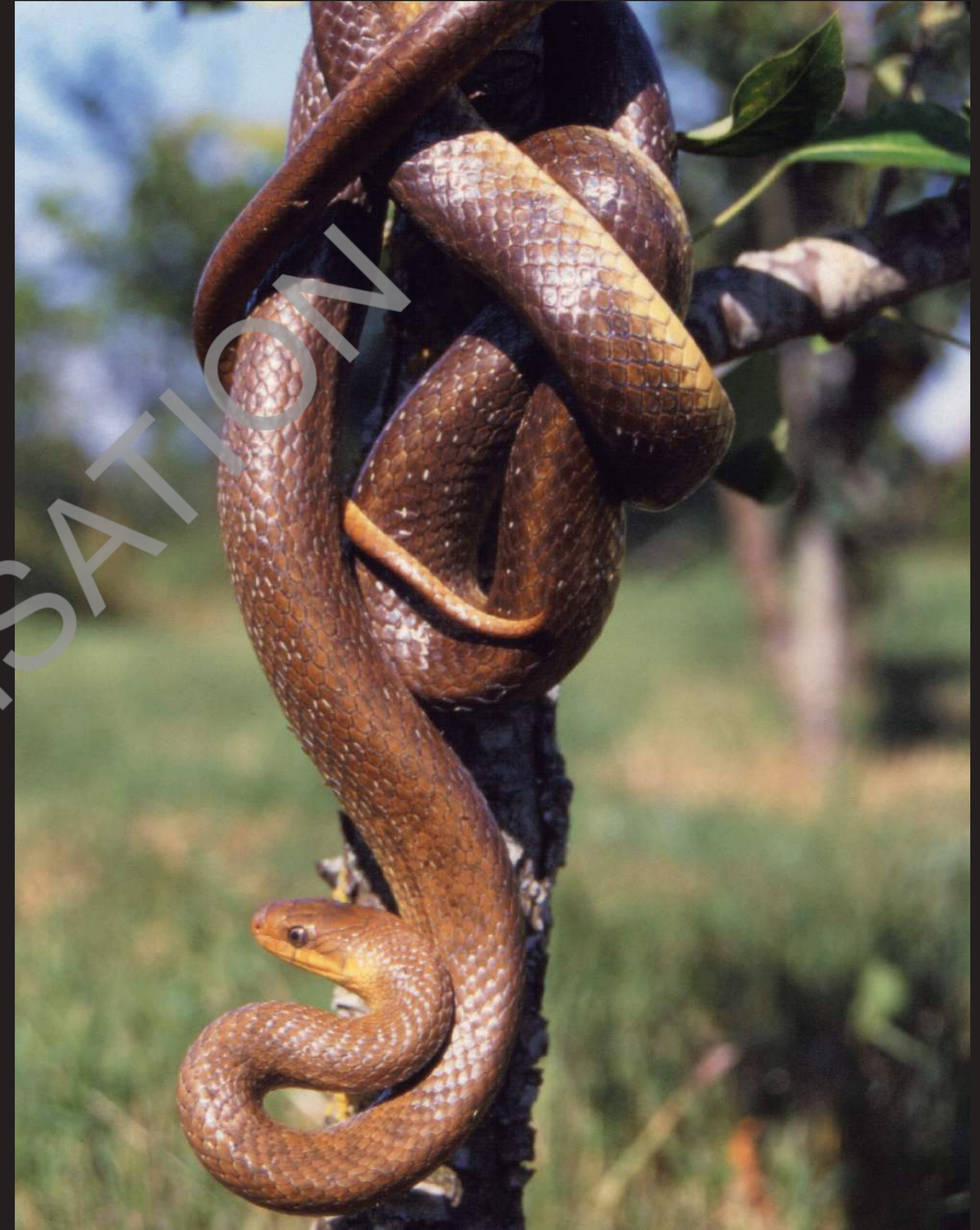
Couleuvre d'esculape