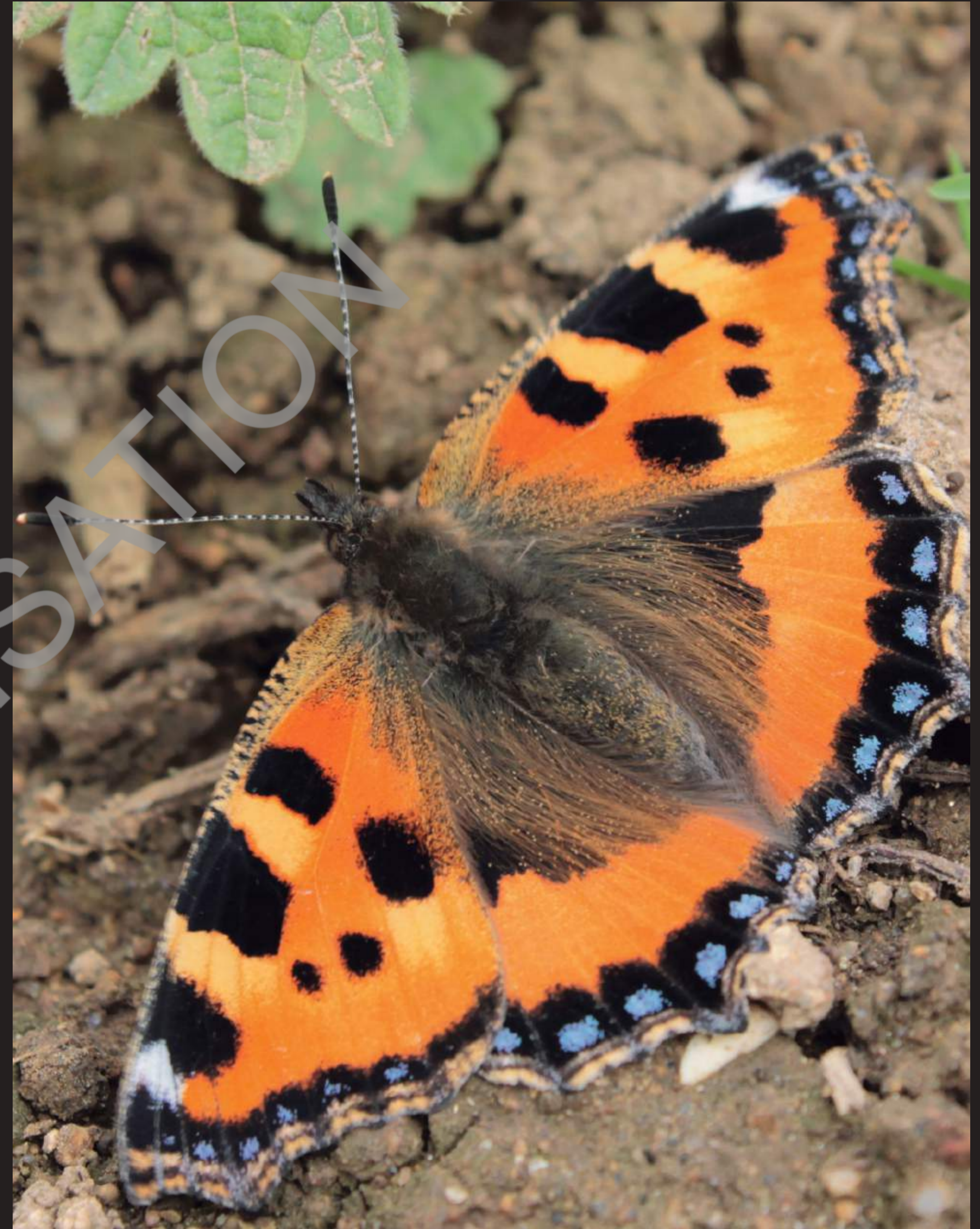
Petite Tortue