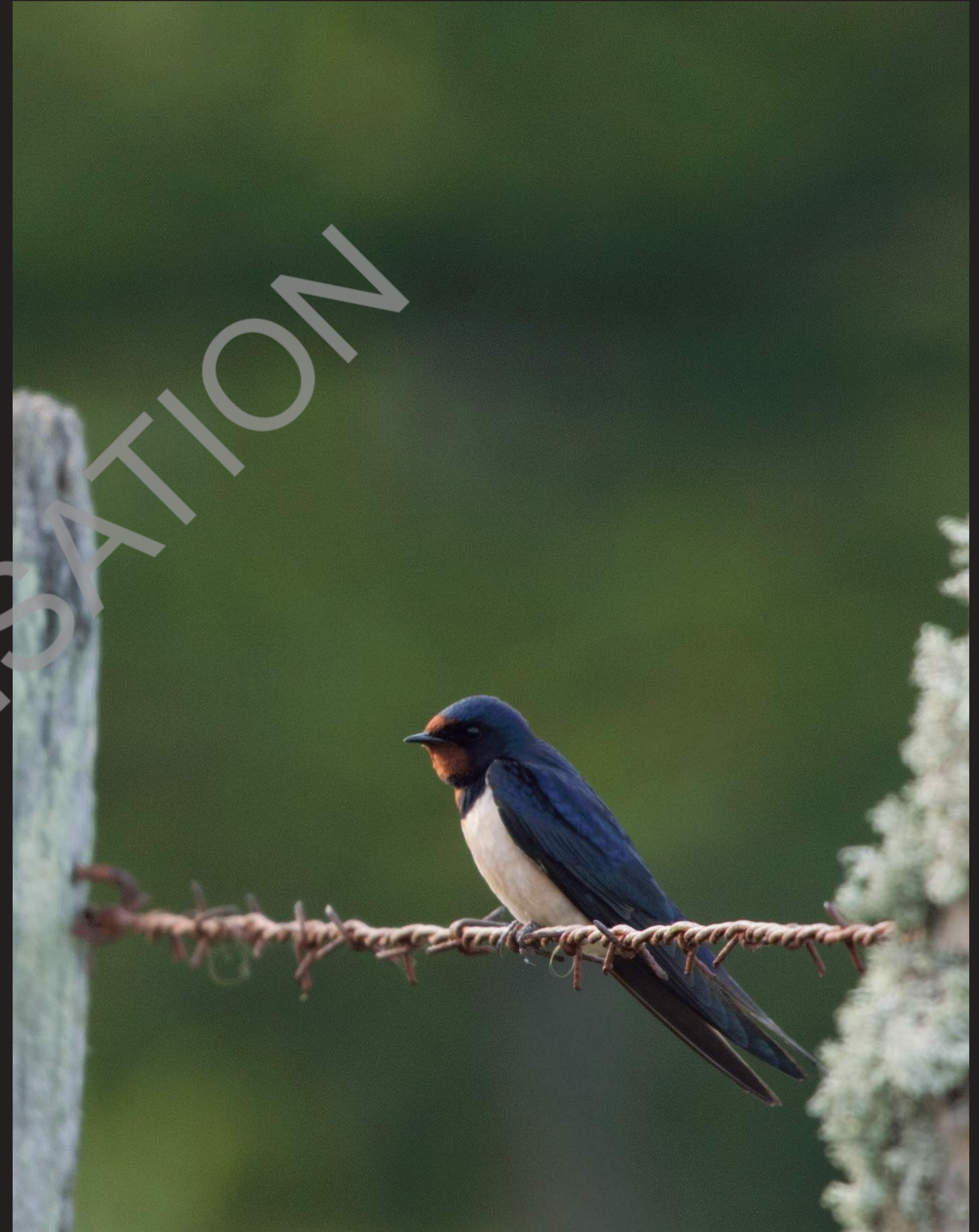
Hirondelle rustique