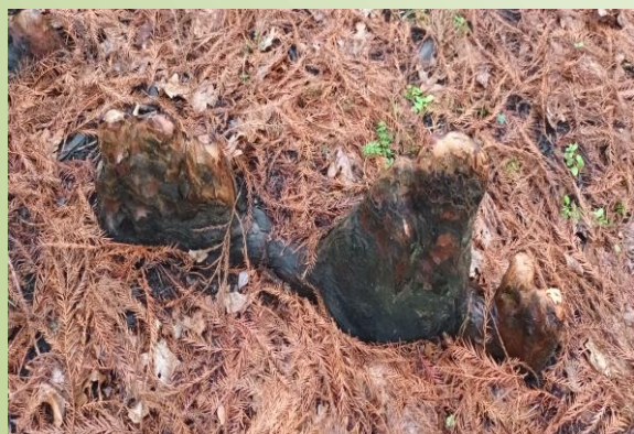
Racines du Cyprès chauve (O. Duval)