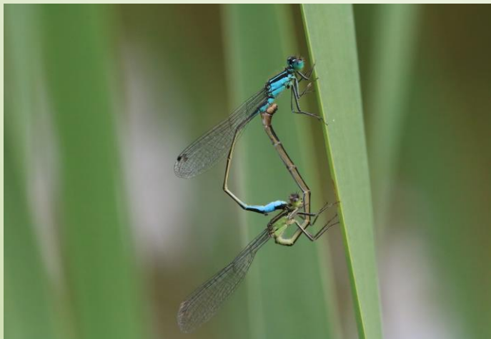
Tandem Agrion élégant (O. Duval)