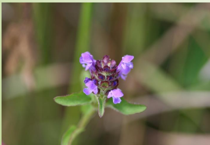
Brunelle (O. Duval)