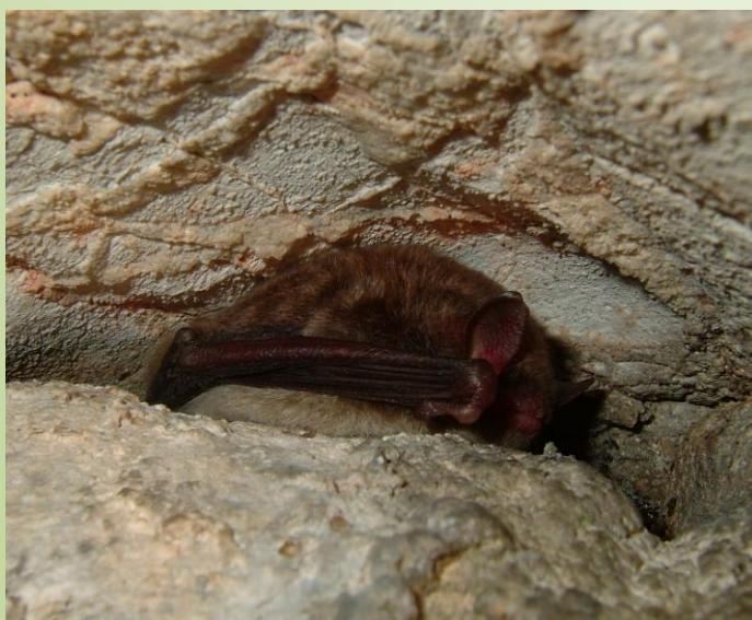
Murin de Daubenton (O. Duval)

Des panneaux pédagogiques réalisés avec l'accueil de loisirs « l'île aux mômes » permettent aux visiteurs de mieux connaître la vallée au naturel. Un parcours de santé, une aire de jeux, un camping avec piscine complètent les équipements de loisirs et de découverte. L'association locale « Cardamine » propose des animations et un parcours botanique temporaire chaque année.