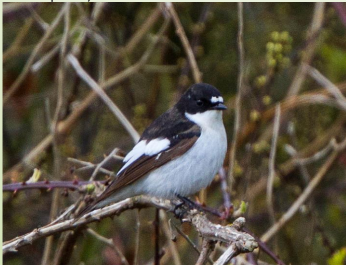
Gobe mouche-noir