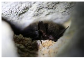
Murin à moustaches mélanique