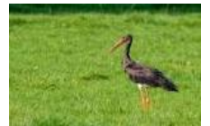
Cigogne noire © Benoit Baudin